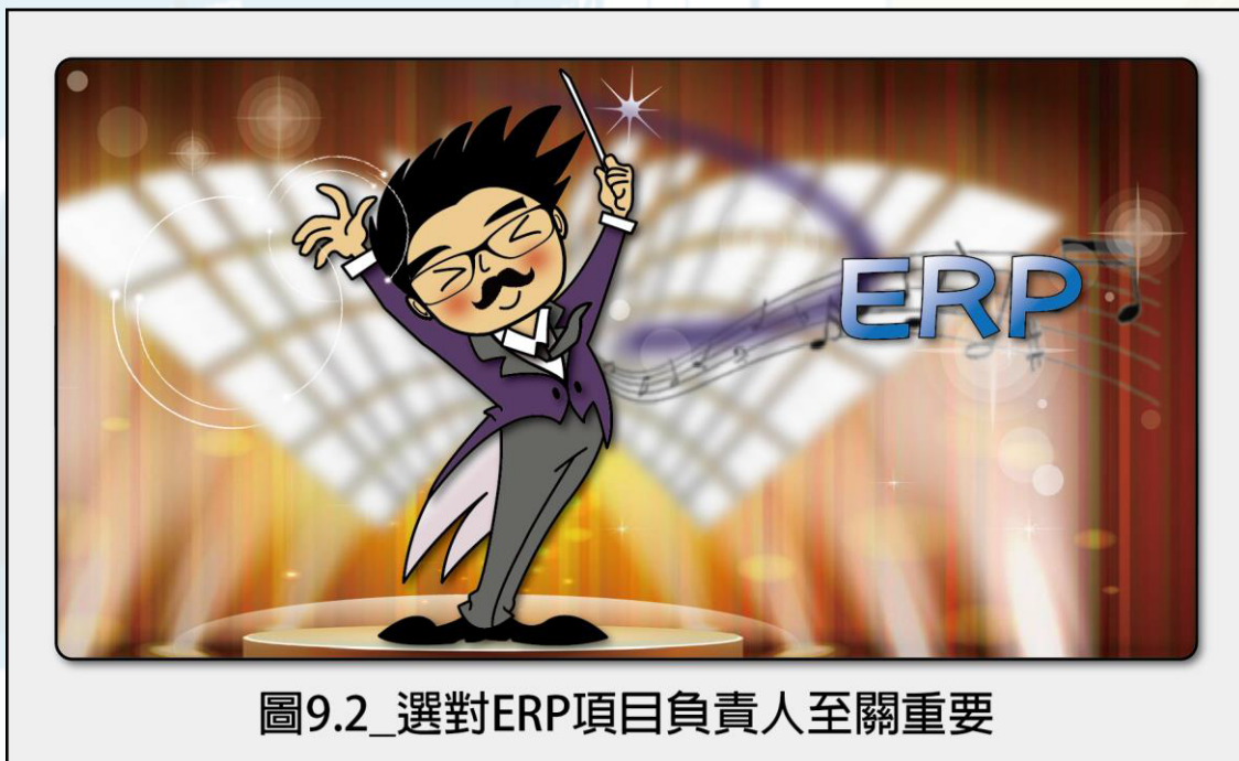
圖9.2_選對ERP項目負責人至關重要

這個人就是主導 ERP 項目的負責人，而他必定是企業的高層主管（如下圖 9.2），要有多高呢？我們舉幾個例子來協助大家做判斷：